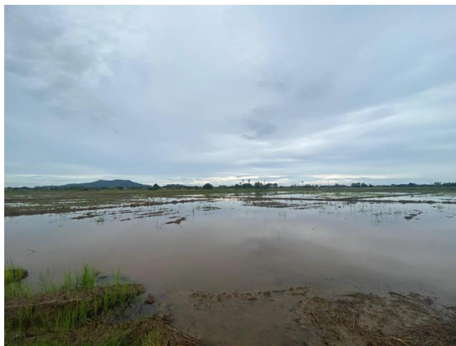
Rajah 4. Sawah padi yang rosak akibat musim tengkujuh