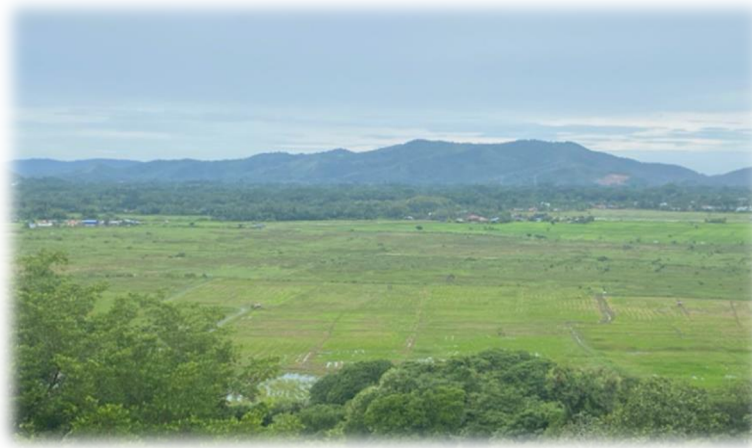
Rajah 3. Kawasan jelapang padi Di Kota Belud

khususnya bagi kawasan K1 dan K2 [26]. Oleh hal yang demikian sektor pertanian yang dilakukan oleh penduduk Kota Belud ialah tanaman padi kerana dianggarkan seramai 9250 orang petani dengan mengusahakan 25,000 ekar sawah padi dengan hasil tuaian bernilai RM 3.75 juta semusim.