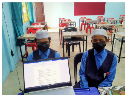
Rajah 1. Temu bual bersama murid

Penggunaan Komik Genius Al-Quran sebagai bahan bantu mengajar dalam pendidikan Al-Quran dapat meningkatkan minat dan motivasi murid. Hal ini kerana komik Genius Al-Quran mempunyai ilustrasi berwarna yang menarik sekaligus dapat mencipta daya tarikan yang signifikan terhadap pelajar. Tambahan, penggunaan elemen visual dan audio dalam komik memainkan peranan penting dalam merangsang deria penumpuan murid. Kombinasi gambar dan audio suara dapat membantu pemahaman dan retensi maklumat dengan lebih baik. Kajian Gunawan dan Sujarwo [7] menunjukkan bahawa komik dapat merangsang deria penumpuan murid sehingga mempengaruhi motivasi murid dalam pembelajaran. Ini adalah aspek penting dalam pembelajaran, terutamanya apabila mempelajari ilmu Al-Quran yang memerlukan tumpuan dan pemahaman yang mendalam. Tambahan, penggunaan ilustrasi berwarna dalam Komik Genius Al-Quran memberikan dimensi tambahan kepada pemahaman dan daya tarikan. Warna dapat membangkitkan emosi dan meningkatkan keterlibatan pelajar. Dengan demikian, inovasi Komik ini bukan hanya memberikan alternatif yang menarik untuk pengajaran Al-Quran, tetapi juga sesuai dengan pendekatan efektif dalam pembelajaran generasi muda yang lebih responsif terhadap media visual dan audio.