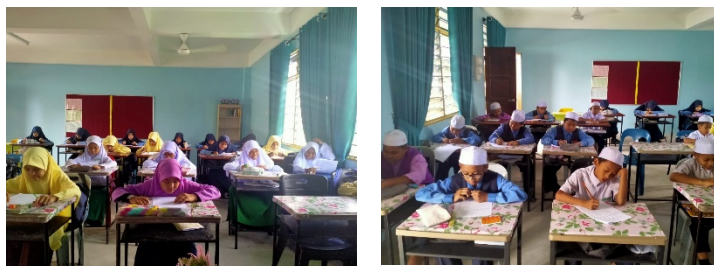
Rajah 4. Murid menjalankan ujian pasca

Hasil analisis data ujian pasca menunjukkan berlakunya peningkatan dalam penguasaan murid terhadap ilmu Al-Quran sebagaimana yang digamabarkan di dalam jadual 3 dan 4 di bawah.