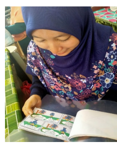
Rajah 3. Penggunaan komik Genius Al-Quran dalam pengajaran dan pembelajaran

Setelah selesai pelaksanaan penggunaan inovasi Komik Genius Al-Quran dalam pembelajaran KAFA selama 2 hari berturut-turut, penulis melaksanakan ujian pasca bagi mengenal pasti maklum balas yang diterima dari kalangan murid tahun 5 yang terlibat untuk membuat penilaian terhadap keberkesanan inovasi Komik Genius Al-Quran tersebut.