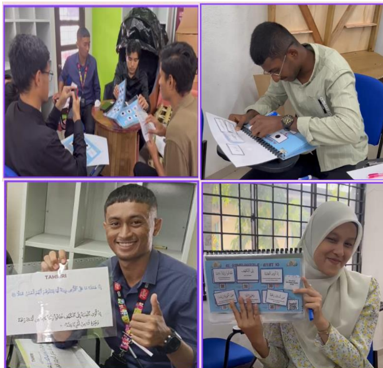
Gambar Rajah 1. Pelaksanaan permainan al-Kahfi Puzzle