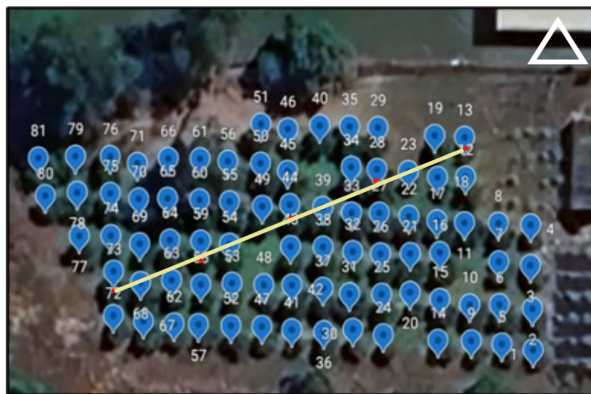
Rajah 1. Peta kajian tanaman pokok limau Taman Botani Bangi UKM