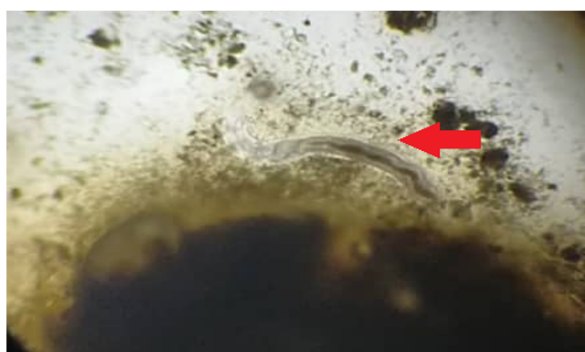
Rajah 3. Kehadiran nematoda EPN (anak panah merah) yang dipencilkan dari tanah pokok limau kasturi

Terdapat 20% sampel tanah bagi pokok berlabel 12 dan 72 mempunyai kehadiran nematoda entomopatogen ditunjukkan pada Rajah 3 serta berjaya diasingkan menggunakan perangkap putih selepas 3 kali proses pemencilan. Faktor biotik seperti keadaan tanah yang bertekstur ringan merupakan keadaan habitat tanah yang disukai oleh nematoda seperti tanah berpasir atau berkelodak Blackshaw [12]. Kehadiran air yang terhad menyebabkan T. molitor mati akibat kekeringan. Terdapat juga T. molitor yang dijangkiti spesies kulat yang telah menyerang semua jenis peringkat hidup nematoda entomopatogen menyebabkan kesukaran proses pemencilan dilakukan Jiang et al. , [13].