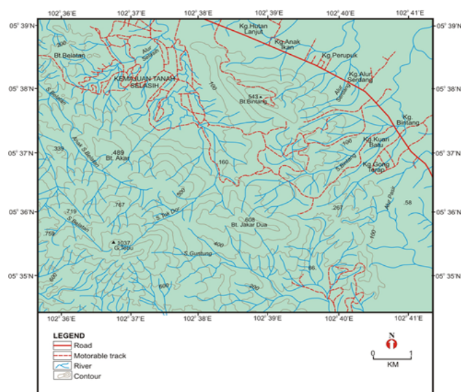
Rajah 1. Peta lokasi Hutan Simpan Gunung Tebu, Setiu, Terengganu

Kajian ini dijalankan di Hutan Simpan Gunung Tebu, Terengganu yang terletak kira-kira 103 km dari bandar Kuala Terengganu dan hanya 15 km from Jertih (Rajah 1). Hutan Simpan Gunung Tebu telah diwartakan sebagai Hutan Simpan Kekal pada Mei 1950 dengan keluasan 25,259 hektar, di bawah bidang kuasa Pejabat Hutan Daerah Terengganu Utara, Jabatan Perhutanan Negeri Terengganu. Puncak tertinggi Gunung Tebu berketinggian 1097 meter yang menjadi daya tarikan kepada pendaki dari Terengganu dan negeri-negeri lain. Terdapat jalan raya ke stesen pemancar telekomunikasi yang terletak pada 543 meter daripada paras laut di sekitar Bukit Bintang.