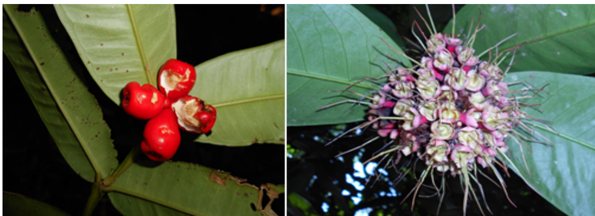
Rajah 2. Spesies Myrtaceae dari Hutan Simpan Gunung Tebu, Terengganu. A. Syzygium claviflorum ; B. S. pycnanthum .